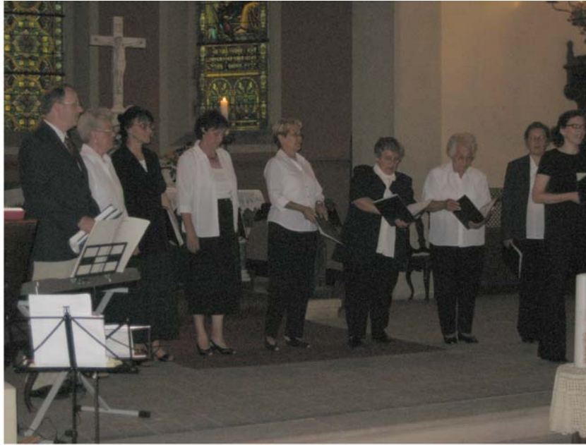
Chor des Pfarrsprengel Unseburg - Tarthun - Wolmirsleben